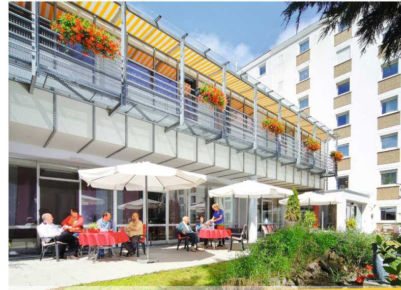
hummel + lang, würzburg

Tel.: 09321 306-0 Fax: 09321 306-100 wilhelm-hoegner-haus@awo-unterfranken.de